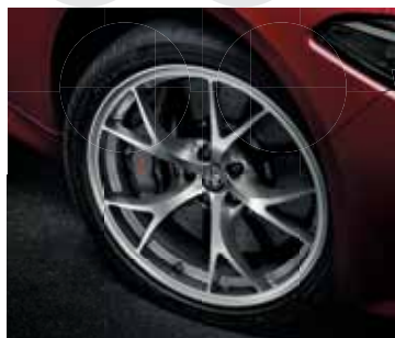
3DC \ 5ER