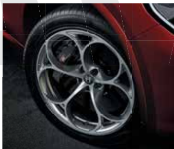
3CZ \ 74A