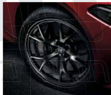
3DA \ 73Z