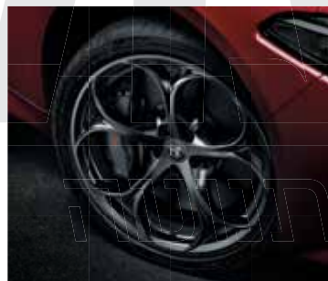
3DB \ 5YN